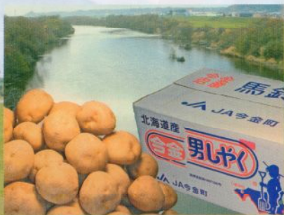
★清流の恵みブランド品「今金男爵」★ (当ホテルホームページより全国発送可)