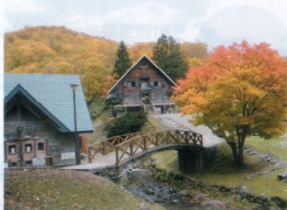
★自然豊かな紅葉の美利河山の家★