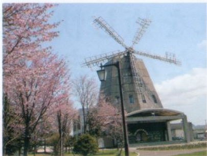
★桜と緑の美しいオランダ通り★